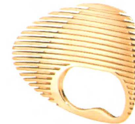
10001593 AX12 10001599, 10001594-98 AX3.0 DOUBLE RING 1623E 750/- GELBGOLD RINGWEITE 50-51 bis 55-56