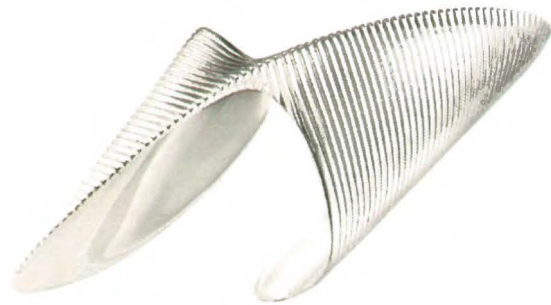
3531378 AX12 3531379-80 AX3.0 TWISTED CUFF 623A STERLING SILBER GRÖSSE: S/M & M/L