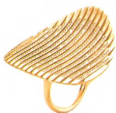
10002341 AX12 10002346-58 AX3.0 RING 1623A 750/- GELBGOLD DIAMANTEN IM BRILLANTSCHLIFF 1.22 CT RINGWEITE 48-60