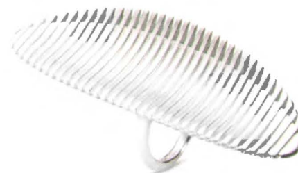
3561340 AX12 3561341-53 AX3.0 LONG RING 623C STERLING SILBER RINGWEITE 48-60