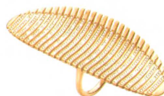
10002381 AX12 10002382-94 AX3.0 RING 1623C 750/- GELBGOLD DIAMANTEN IM BRILLANTSCHLIFF 1.41 CT RINGWEITE 48-60