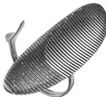
3531371 AX12 3531372-73 AX3.0 LONG CUFF 623C STERLING SILBER, SCHWARZ PVD BESCHICHTET SCHWARZE DIAMANTEN IM BRILLANTSCHLIFF

GRÖSSE: S/M 6.86 CT ~ 2144 SCHWARZE DIAMANTEN €33600.- M/L : Auf Anfrage