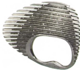
3561280 AX12 3561281-86 AX3.0 DOUBLE RING 623E STERLING SILBER, SCHWARZ PVD BESCHICHTET SCHWARZE DIAMANTEN IM BRILLANTSCHLIFF 1.11 CT RINGWEITE 50-51 bis 55-56 € 6725.-