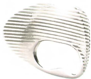
3561380 AX12 3561381-86 AX3.0 DOUBLE RING 623E STERLING SILBER RINGWEITE 50-51 bis 55-56