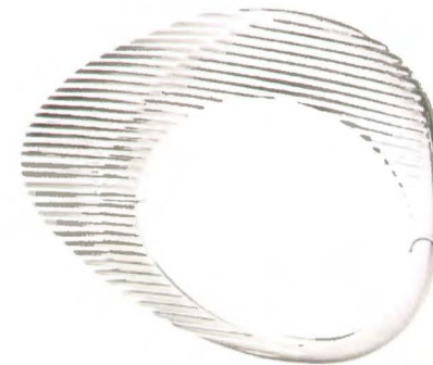
3531384 AX12 3531385-87 AX3.0 BANGLE 623E STERLING SILBER GRÖSSE: S, M & L