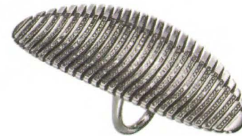
3561240 AX12 3561241-53 AX3.0 RING II 623B STERLING SILBER, SCHWARZ PVD BESCHICHTET SCHWARZE DIAMANTEN IM BRILLANTSCHLIFF 1.41 CT RINGWEITE 48-60 € 7400.-