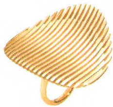
10001628 AX12 10001629-41 AX3.0 RING 1623A 750/- GELBGOLD RINGWEITE 48-60