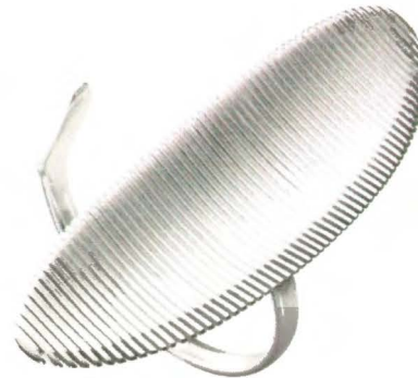
3531381 AX12 3531382-83 AX3.0 LONG CUFF 623C STERLING SILBER GRÖSSE: S/M & M/L