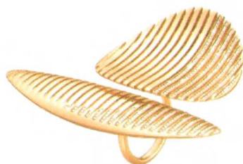
10002362 AX12 10002367-79 AX3.0 RING 1623D 750/- GELBGOLD DIAMANTEN IM BRILLANTSCHLIFF 1.02 CT RINGWEITE 48-60