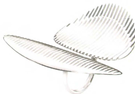
3561360 AX12 3561361-73 AX3.0 TWIN RING 623D STERLING SILBER RINGWEITE 48-60