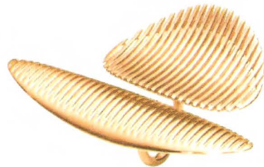
10001600 AX12 10001601-13 AX3.0 RING 1623D 750/- GELBGOLD RINGWEITE 48-60