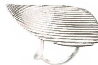
3561320 AX12 3561321-33 AX3.0 LAMELLAE RING II 623B STERLING SILBER RINGWEITE 48-60