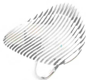
3561300 AX12 3561301-13 AX3.0 RING I 623A STERLING SILBER RINGWEITE 48-60