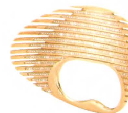
10002395 AX12 10002401, 10002396-400 AX3.0 DOUBLE RING 1623E 750/- GELBGOLD DIAMANTEN IM BRILLANTSCHLIFF 1.11 CT RINGWEITE 50-51 bis 55-56