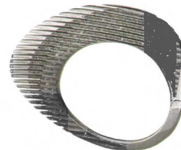
3531374 AX12 3531375-77 AX3.0 BANGLE 623E STERLING SILBER, SCHWARZ PVD BESCHICHTET SCHWARZE DIAMANTEN IM BRILLANTSCHLIFF

GRÖSSE: S/M 1.47 CT € 8975.- M/L 1.76 CT € 10700.-