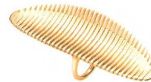
10001614 AX12 10001615-27 AX3.0 RING 1623C 750/- GELBGOLD RINGWEITE 48-60