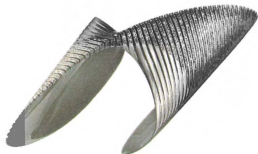
3531368 AX12 3531369-70 AX3.0 TWISTED CUFF 623A STERLING SILBER, SCHWARZ PVD BESCHICHTET SCHWARZE DIAMANTEN IM BRILLANTSCHLIFF

GRÖSSE: S/M 6.86 CT ~ 2144 SCHWARZE DIAMANTEN €33600.- M/L : Auf Anfrage